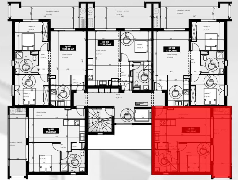
Plan d'étage courant R+1