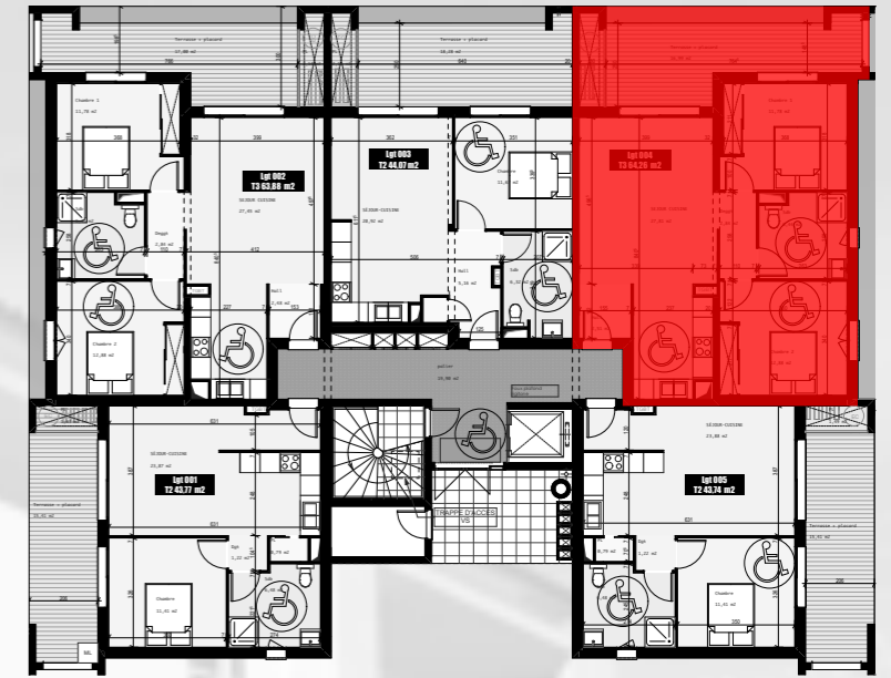
Plan d'étage courant RDC