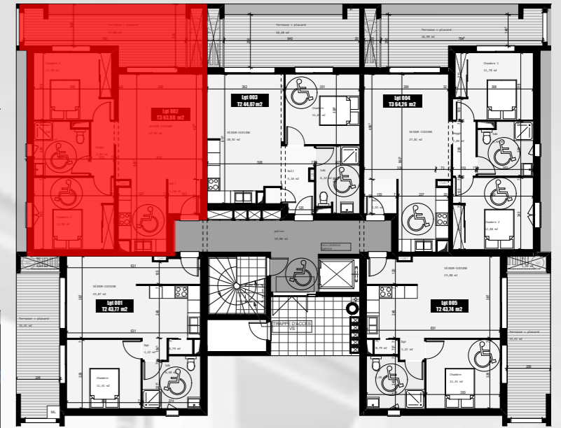
Plan d'étage courant RDC