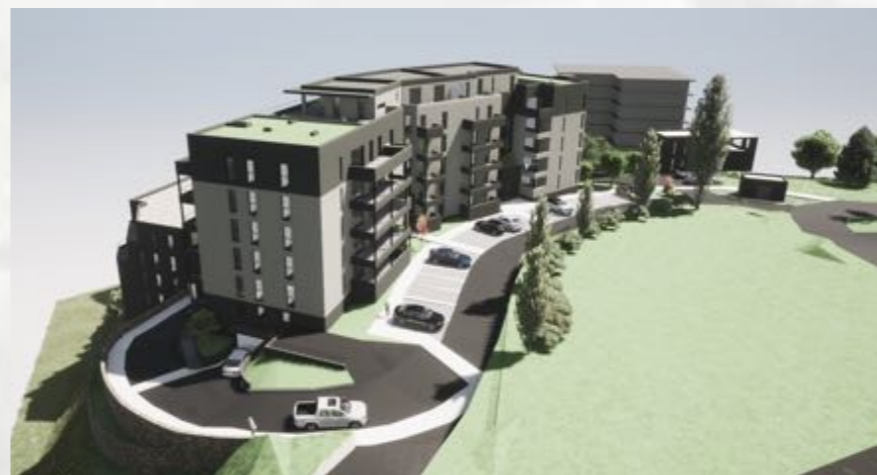
Situation sur façade Ouest