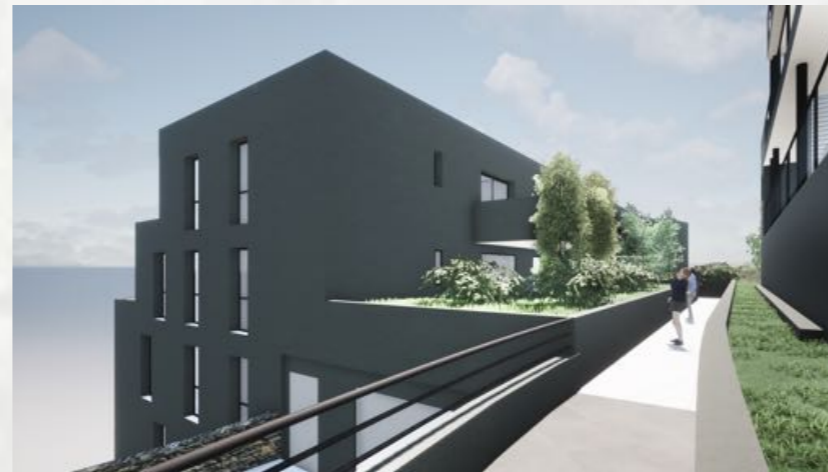
Situation sur étage R-1