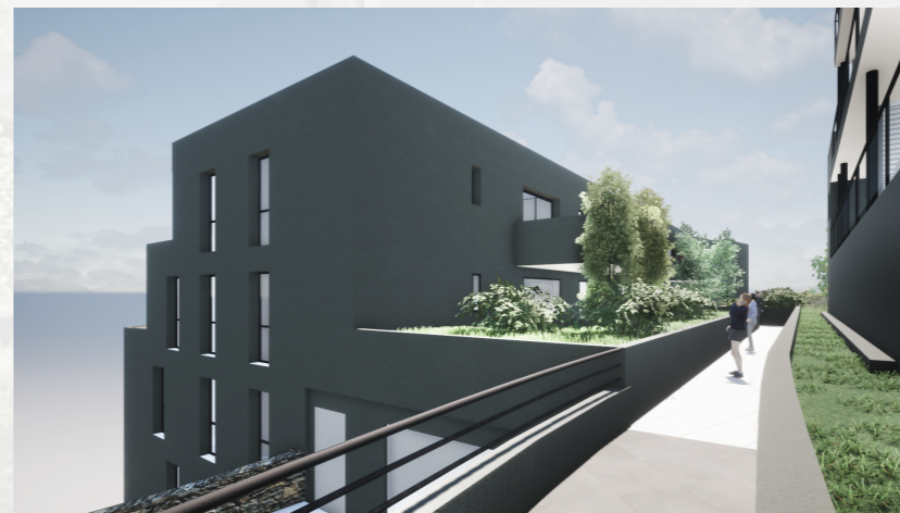
Situation sur étage R-6