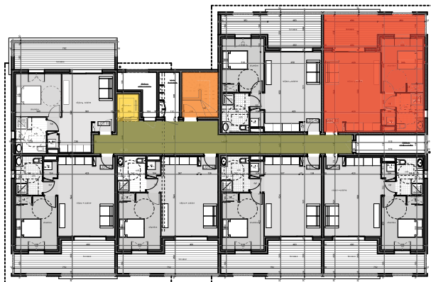
Plan de repérage par étage