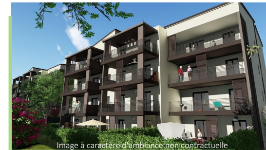
Image à caractère d'ambiance non contractuelle