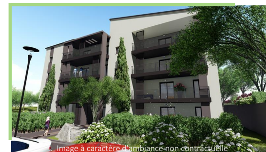
Image à caractère d'ambiance non contractuelle

Ce plan est susceptible d'être modifié en fonction des techniques de construction utilisée. Les côtes et les surfaces sont données à titre indicatif et pourront subir des modifications.