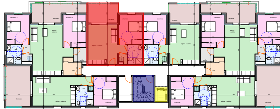
TABLEAU DE SURFACES