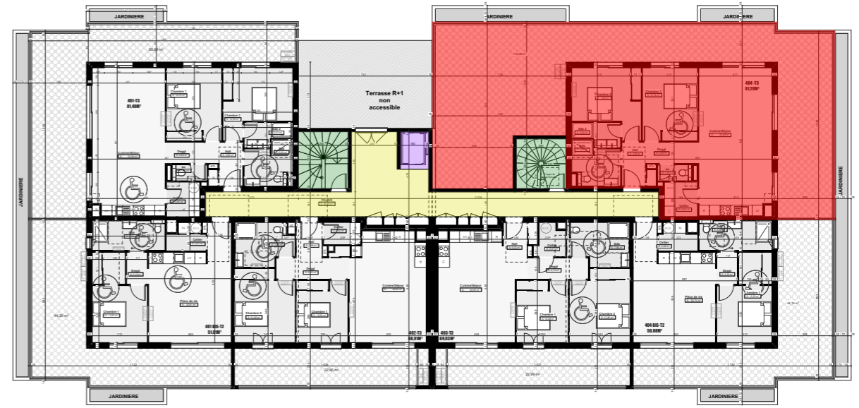
Plan d'étage courant R+4